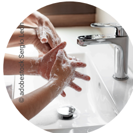
Warmwasser + Flüssigseife