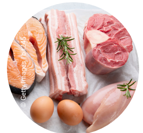
Kontakt mit rohem Fleisch/Faschierten, Geflügel, Fisch, Eier