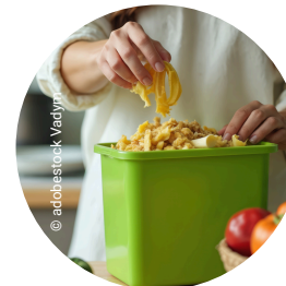
Kontakt mit Abfällen