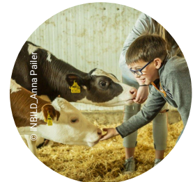
Berühren und Streicheln von Tieren