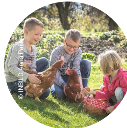
Kontakt mit Eiern