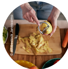
Kontakt mit Lebensmitteln, die mit Erde kontaminiert sein können: Gemüse, Obst, Salat, Kräuter